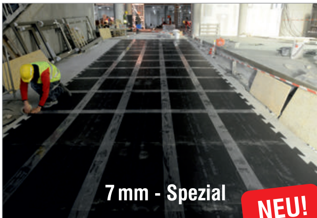
7 mm - Spezial