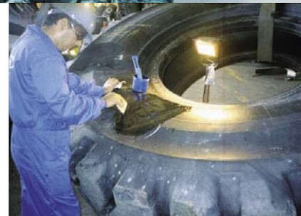
Reparatur an Geländereifen